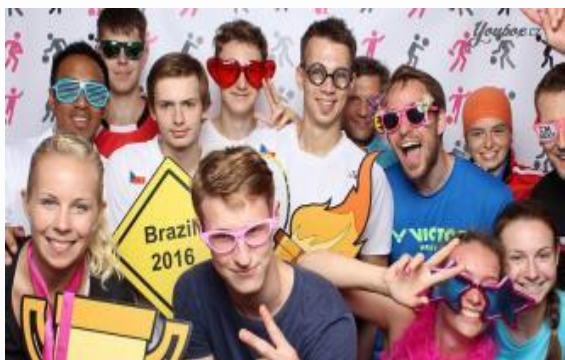
Olympijský park Lipno